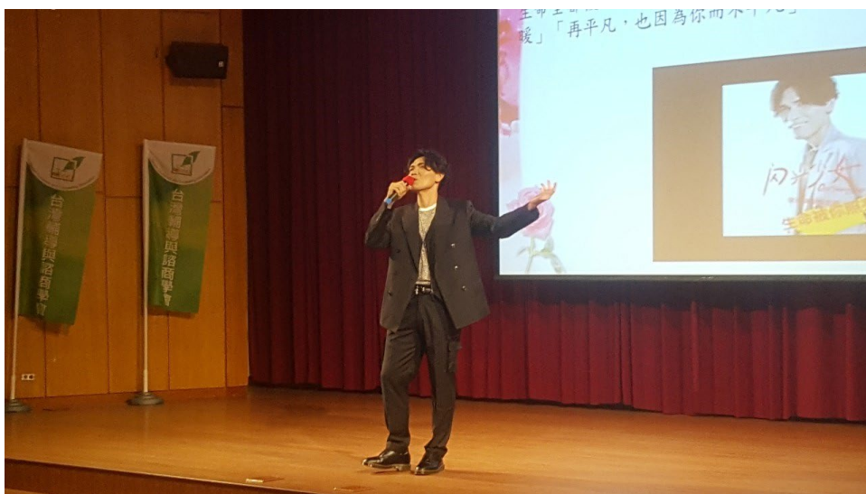
2019.10.19 攝於台灣輔導與諮商學會 2019 年會暨學術研討會現場